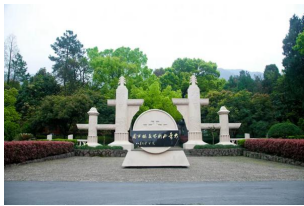
大奇山国家森林公园