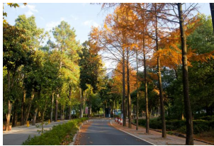
大奇山国家森林公园