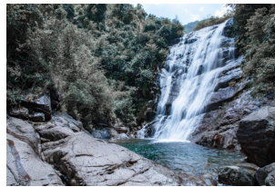
大奇山国家森林公园